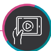
Таблица размерных рядов, видео по сборке и разборке оборудования

Видеоматериал с инструкцией построения урока Kangoo Power™